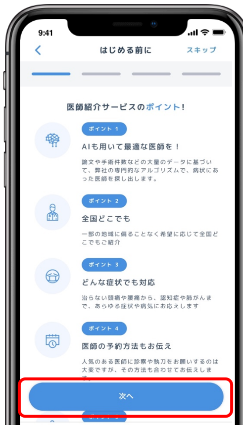
クリンタル ホーム画面