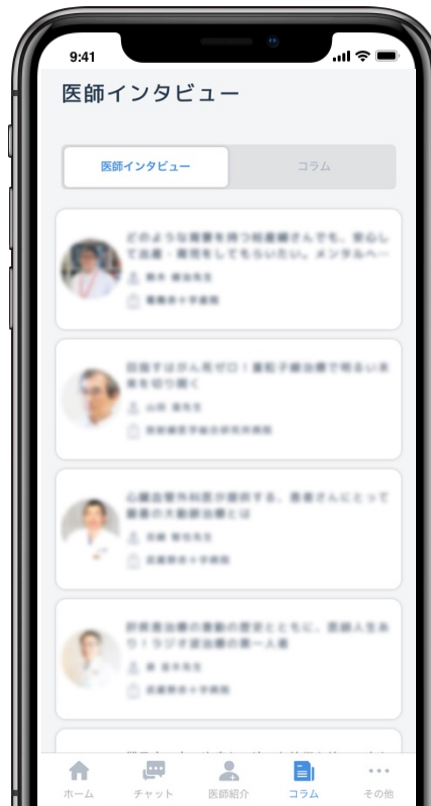
医師インタビュー