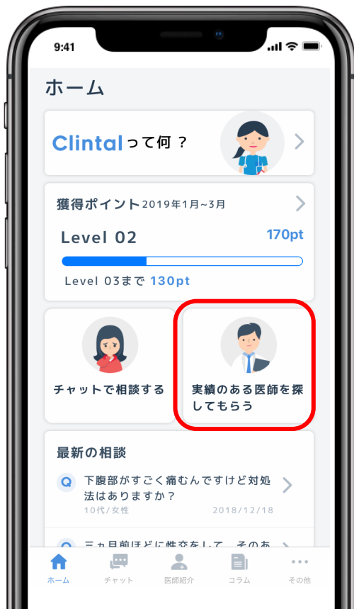
クリンタル ホーム画面