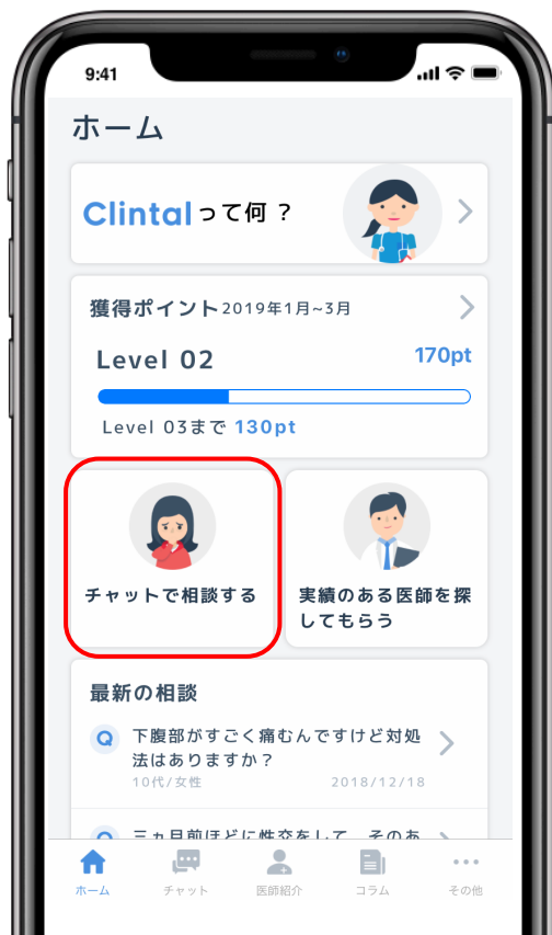
クリンタル ホーム画面