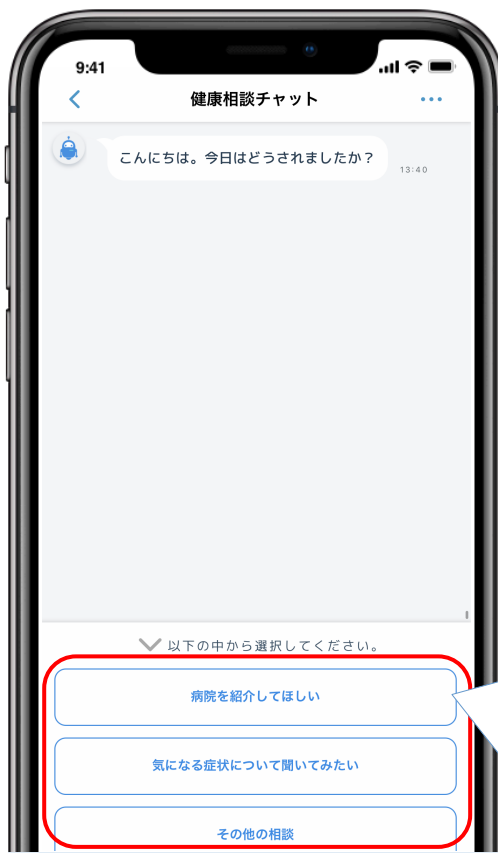
健康相談チャット