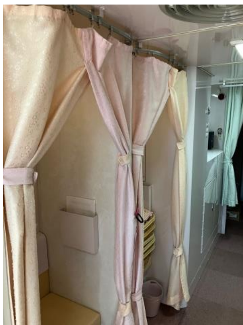
乳がん (マンモグラフィ) 検診車