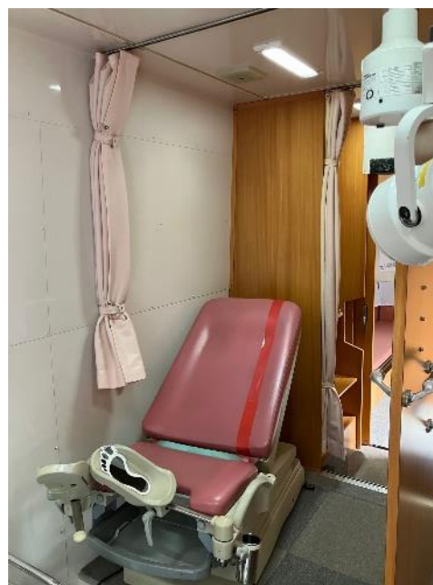
子宮頸がん検診車